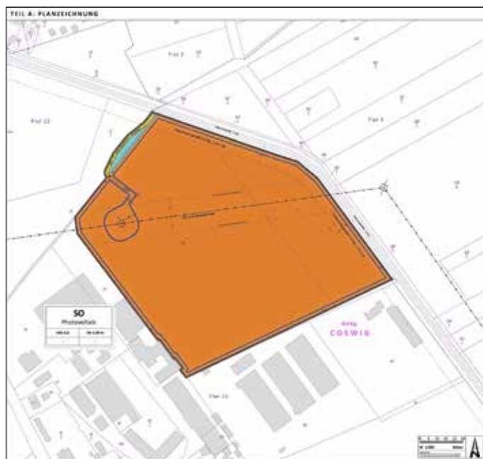
Geltungsbereich des Bebauungsplanes (Auszug aus der Planzeichnung)