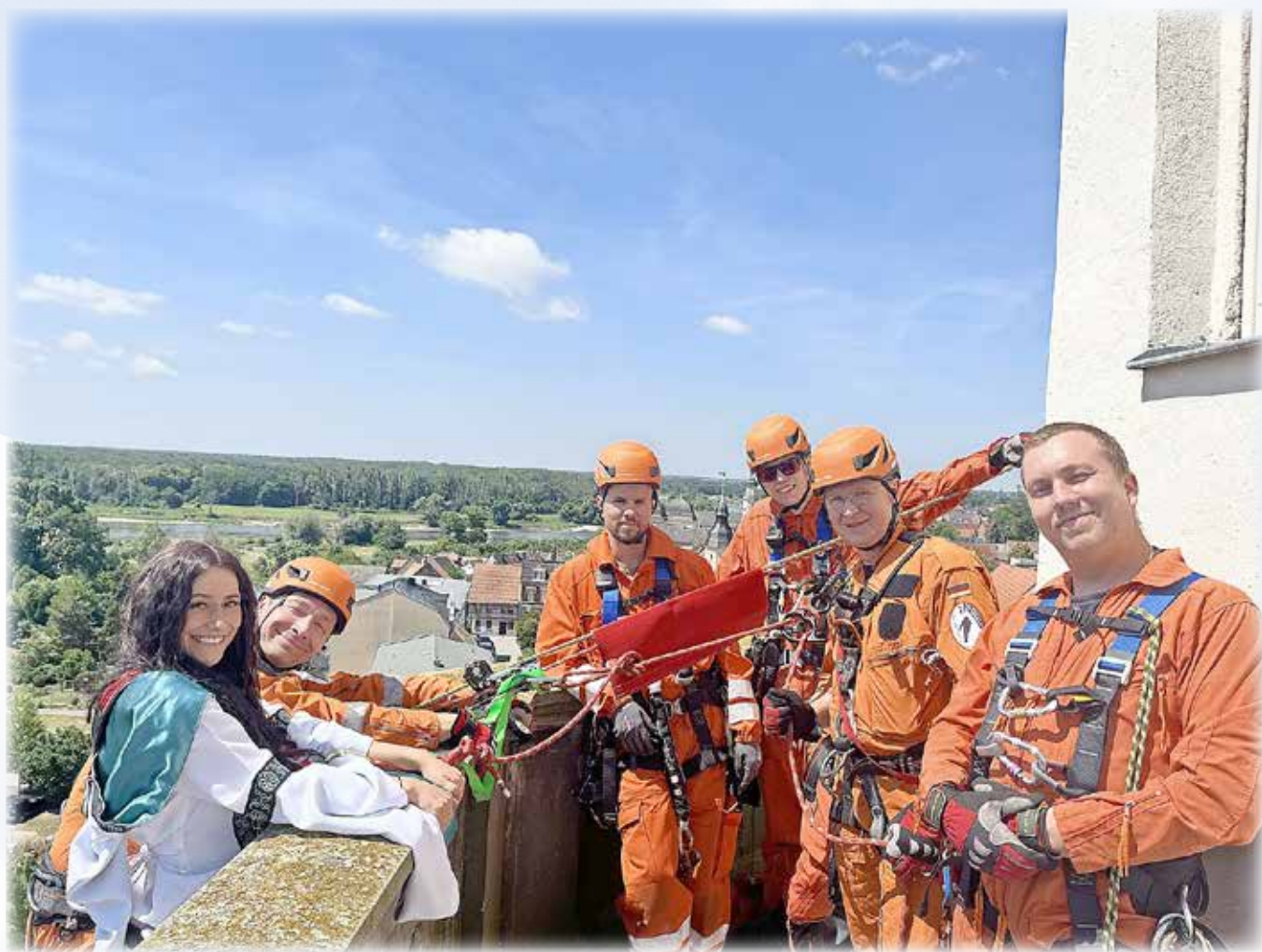
Fürstin Cordula und die Höhenrettung Coswig (Anhalt)