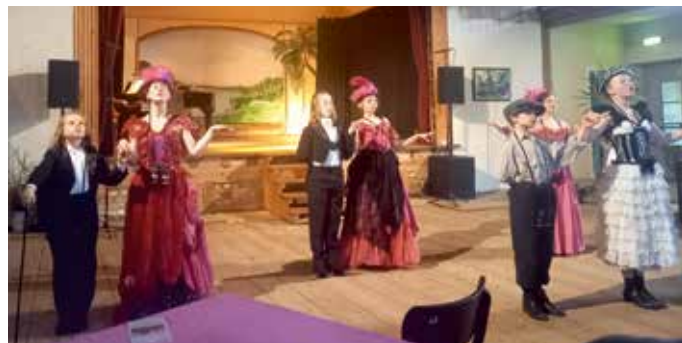
Zweites Coswiger Kids-Musical bietet „My Fair Girls“ - Workshop im Coswiger Simonetti Haus.

Der Unkostenbeitrag beträgt 5 € (für Jugendliche bis 18 Jahre 3 €; für Kinder bis 6 Jahre frei).