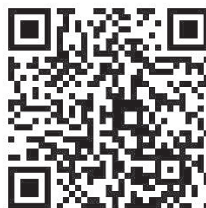
QR-Code zum Veran- staltungs- melder

Ihr Amt für Bildung, Kultur und Soziales