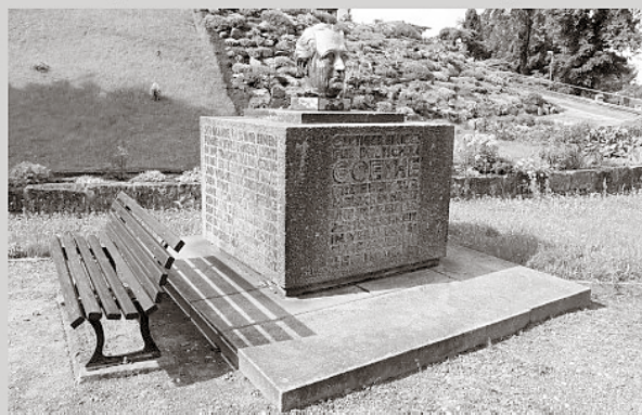
Das Goethe-Denkmal am Coswiger Fließ