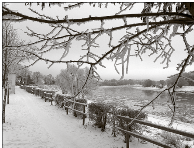
„Elbe im Winter“ von Manfred Ertelt

„Bürger gestalten ihren Kalender selber“