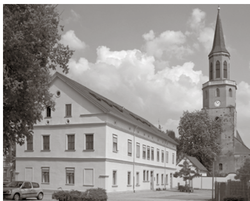
Das Coswiger Amtshaus