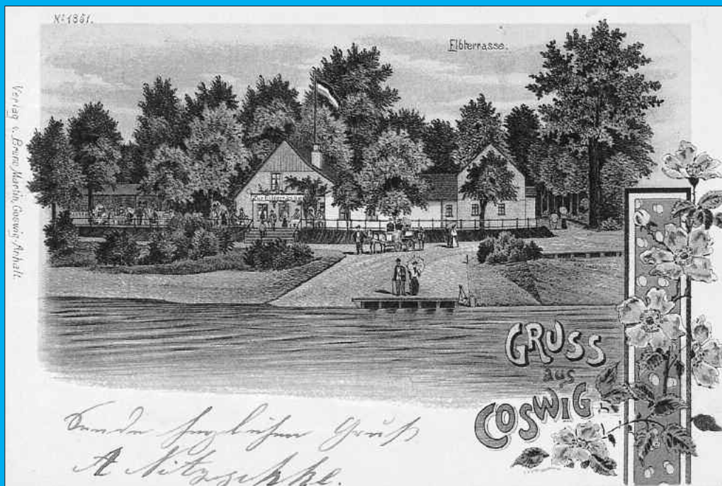
Postkarte um 1900 Stadtarchiv Coswig (Anhalt)