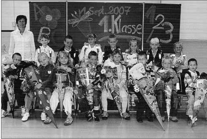
Grundschule am Schillerpark Kl. 1