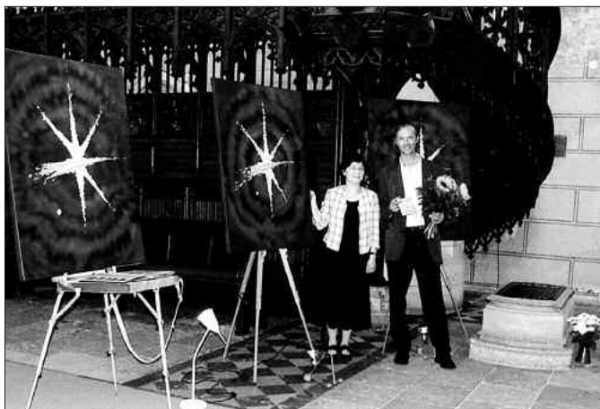
„Happy Moment Coswig - Wittenberg“