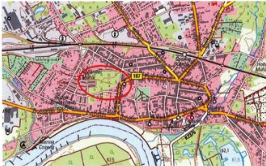
Abbildung 1: Lage des Plangebiets in der Kernstadt, DTK 25

Die Lage und Abgrenzung des Plangebiets ist in den nachstehenden Kartenausschnitten (beide Abbildungen ohne Maßstab) dargestellt.