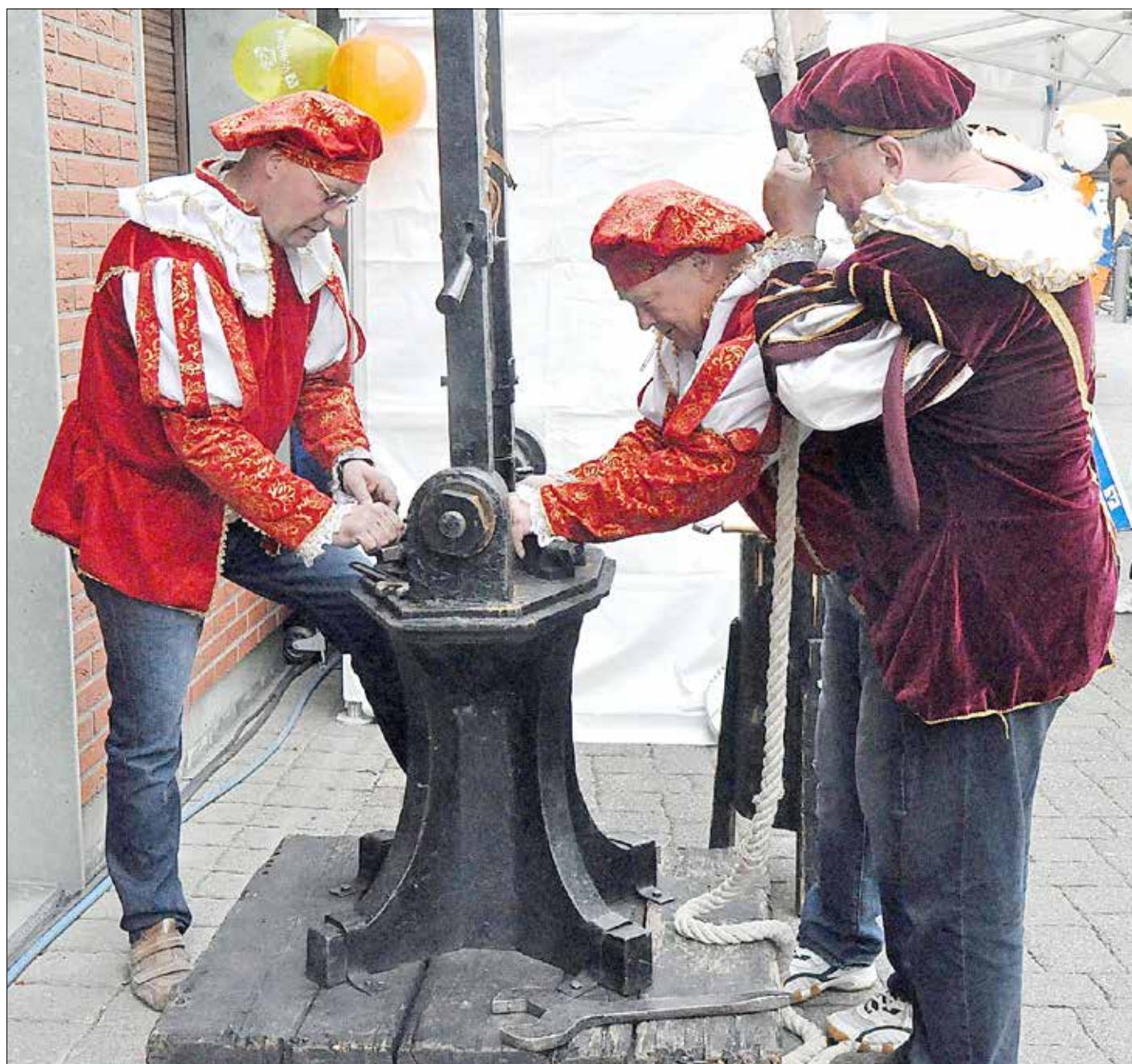
Prägestock Laurentiustaler im Jahr 2012 zur 800-Jahr-Feier der Stadt Coswig (Anhalt)