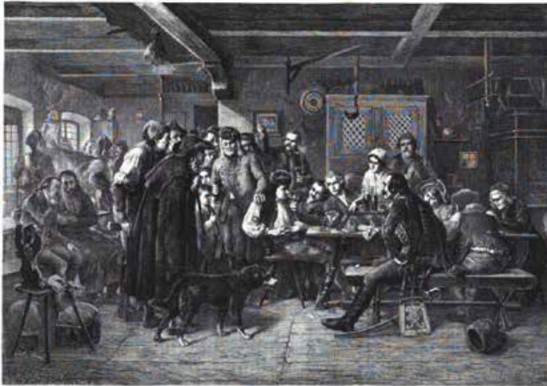
Preußische Werber unter Friedrich dem Großen