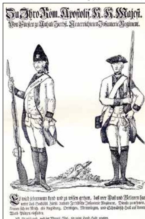
Werbeplakat um 1740

"Zu Ihro Röm. Apostolisch. K.K. Majest./ Von Fürsten zu Anhalt Zerbst. Neuerrichteten Infanterie Regiment./ Es wird jedermann kund und zu wissen gethan, daß wer Lust und Belieben hat/ unter das Hochlöbl. Fürstl. Anhalt-Zerbstische Infanterie Regiment, Dienste zu nehmen,/ können sich im Reich, als Augsburg, Oettingen, Memmingen, und Schwäbisch-Hall auf denen/ Werb-Plätzen einfinden./ NB. Es wird auch, nach der Mannes-Mas, ein gutes Hand-Geld gegeben."