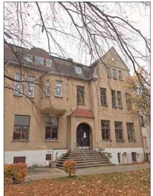
Ansicht zur Straße