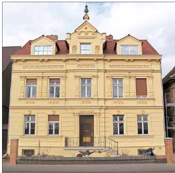
Projekthaus Zerbster Straße 42 - vor und nach der Fassadensanierung