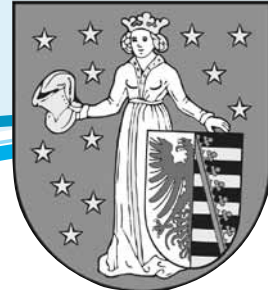
Postkarte Stadtarchiv von 1929