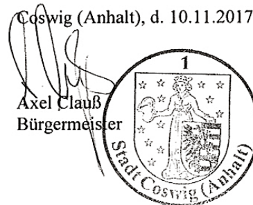
Axel Clauß Bürgermeister