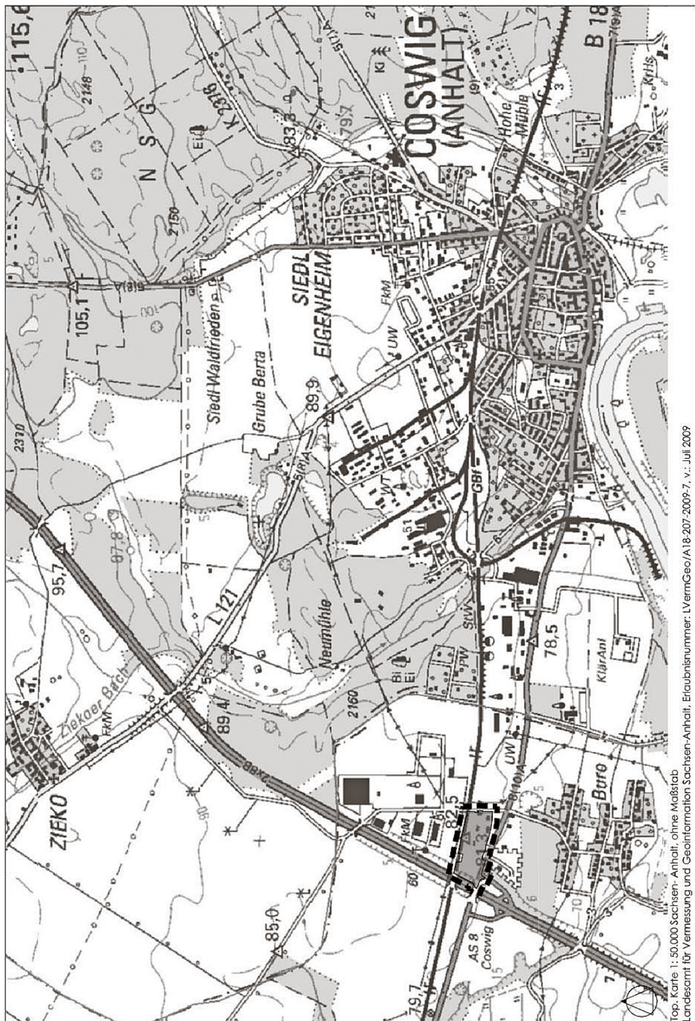
Top. Karte 1: 50.000 Sachsen-Anhalt, ohne Maßstab Landesamt für Vermessung und Geoinformation Sachsen-Anhalt, Erlaubnisnummer: LVermGeo/A18-207-2009-7, v.: Juli 2009