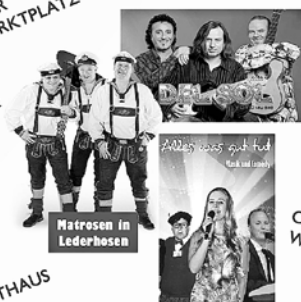
Matrosen in Lederhosen