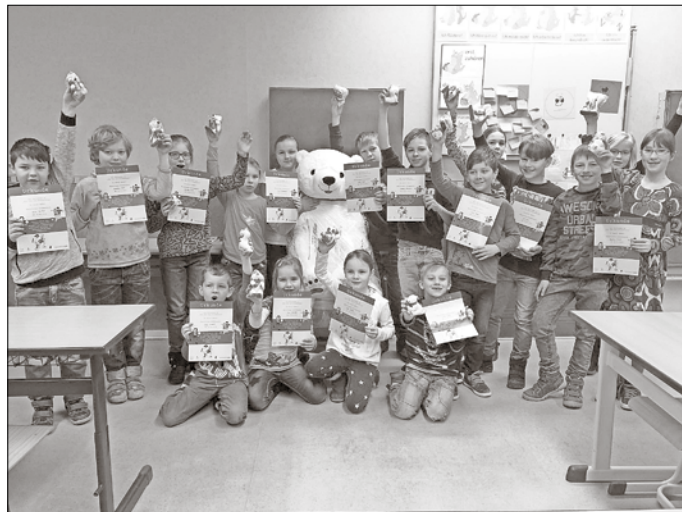
Unsere erfolgreichen Sportler

Vorsitzende Schulleiternrat der Ein-Stein-Grundschule Klieken