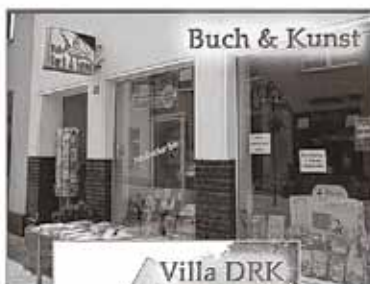
Buch & Kunst

hören Sie spannende Geschichten vor 9 Coswiger Kulissen ab 19.00 Uhr