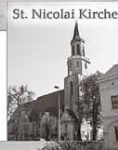
St. Nicolai Kirche