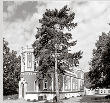
Die "Villa Eichburg" im Sommer 2015