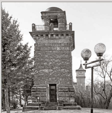
Der Bismarckturm auf dem Hubertusberg bei Coswig