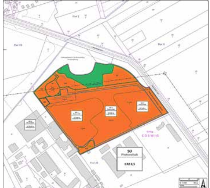
Geltungsbereich des Bebauungsplanes (Auszug aus der Planzeichnung)

Landesamt für Vermessung und Geoinformation Sachsen-Anhalt (LVermGeo ST), 03/2023