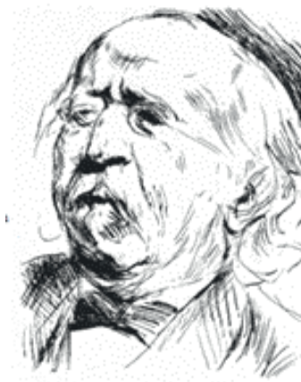
Hermann Cohen, Porträt von Max Liebermann, 1912