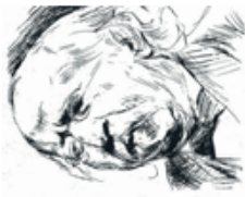
Hermann Cohen, Porträt von Max Liebermann, 1912

anlässlich des 25-jährigen Bestehens der Cohen- Gesellschaft Coswig (Anhalt) e. V.