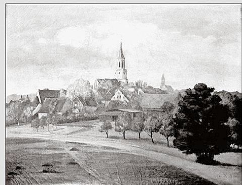
Die Kirche „St. Nicolai“ zu Coswig auf einem Gemälde von Karl Kothe (1946)