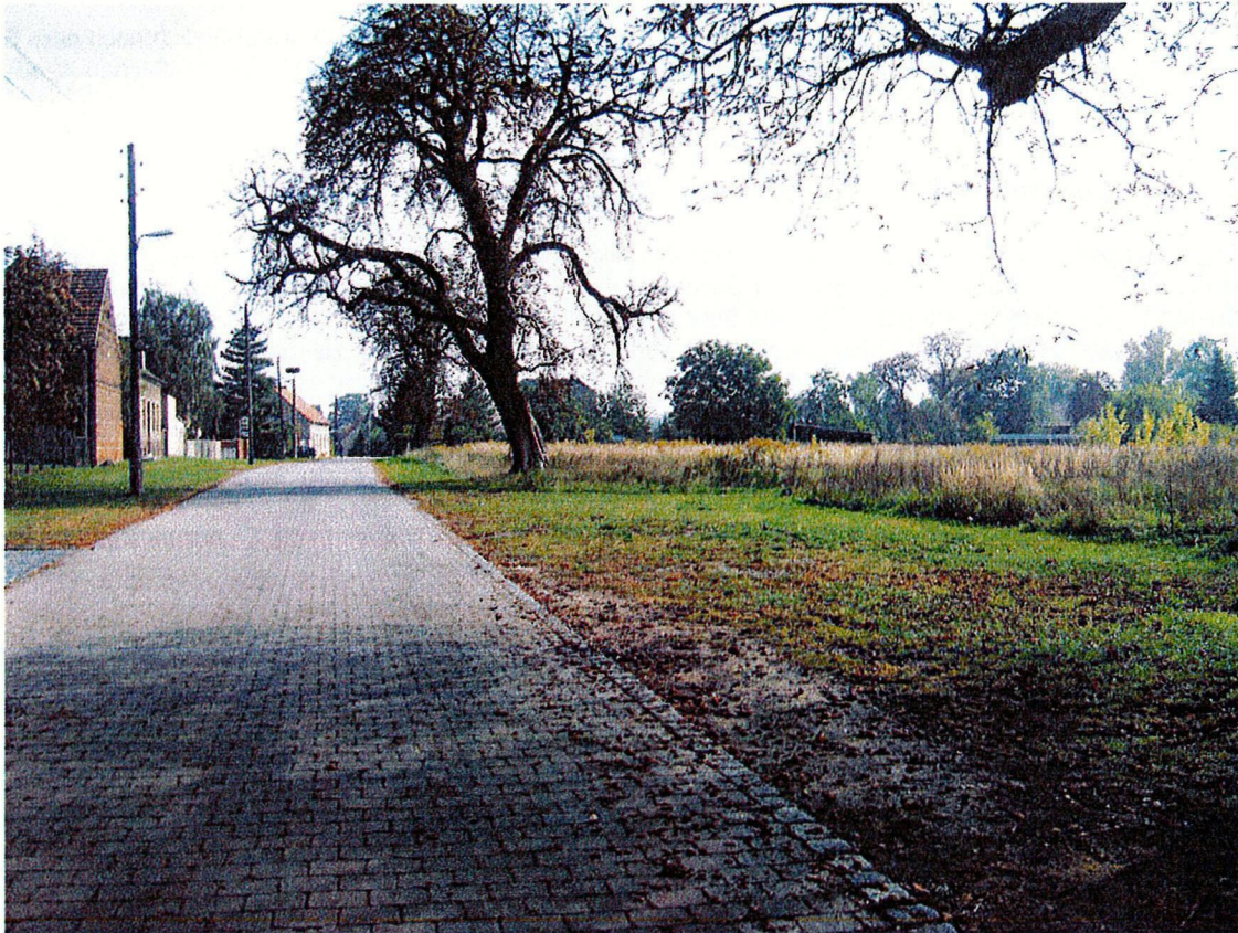
Ergänzungsfläche Nr. 1 südlich der Mittelstraße; Ansicht von der Mittelstraße Richtung Osten