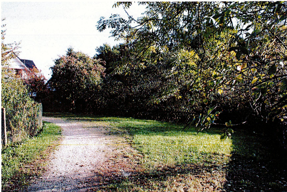
Ergänzungsfläche Nr. 3 südöstlich des Friedhofs; Ansicht Richtung Südost

Der Entwurf des Flächennutzungsplans berücksichtigt noch nicht diese Bauflächenausweisung. Sie beruht auf Erkenntnissen und Zielen des fortschreitenden Planungsprozesses der städtebaulichen Entwicklung der Ortslage Buro. Die Gemeinde wird den Entwurf des Flächennutzungsplans dahingehend ändern und anpassen.