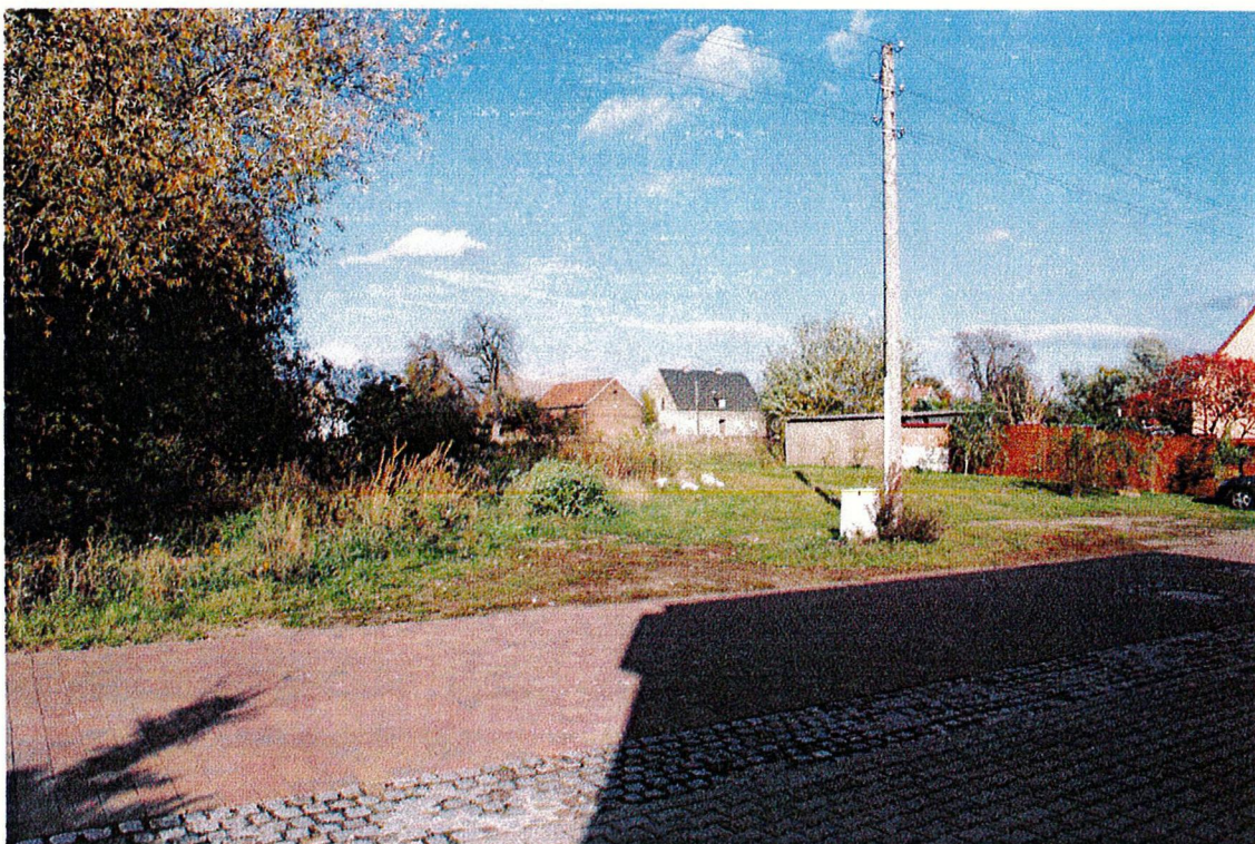
Ergänzungsfläche Nr. 2 nördlich des Aueweges; Ansicht vom Aueweg Richtung Nordost

Die Ergänzungsfläche Nr. 2 liegt nördlich des Aueweges im südlichen Abschnitt der ehemaligen „Domäne“ in Buro.