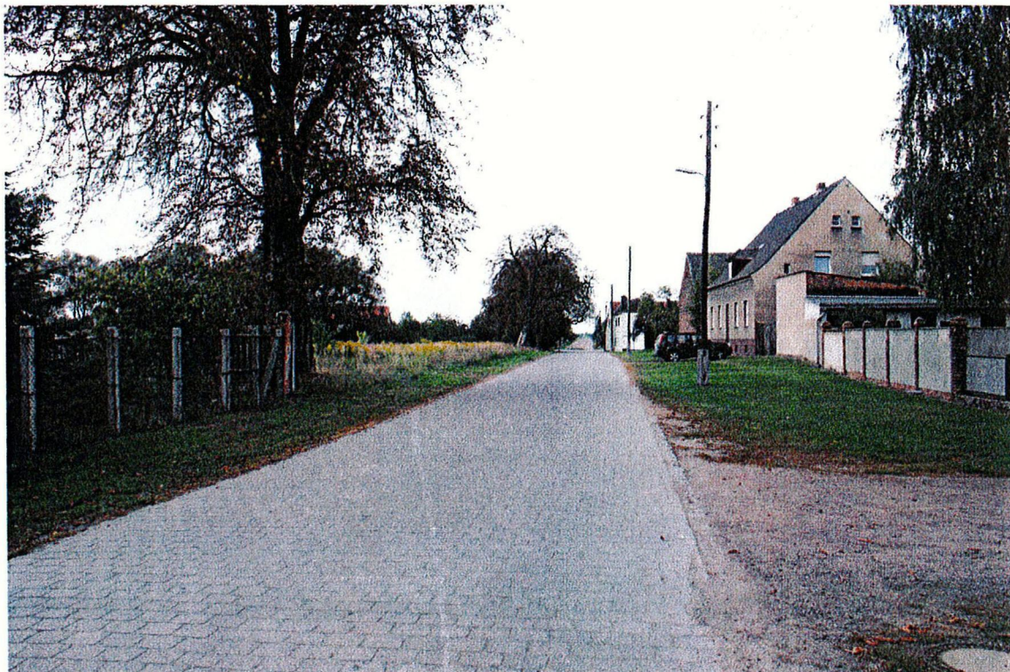
Ergänzungsfläche Nr. 1 südlich der Mittelstraße; Ansicht von der Mittelstraße Richtung Westen

Darüber hinaus ist die beabsichtigte Entwicklung einer Streuobstwiese mit Heckensaum auf der rückwärtigen Freifläche eine wichtige Maßnahme zur ökologischen Aufwertung der Brache im Kontext zu den Zielen von Natur und Landschaft.