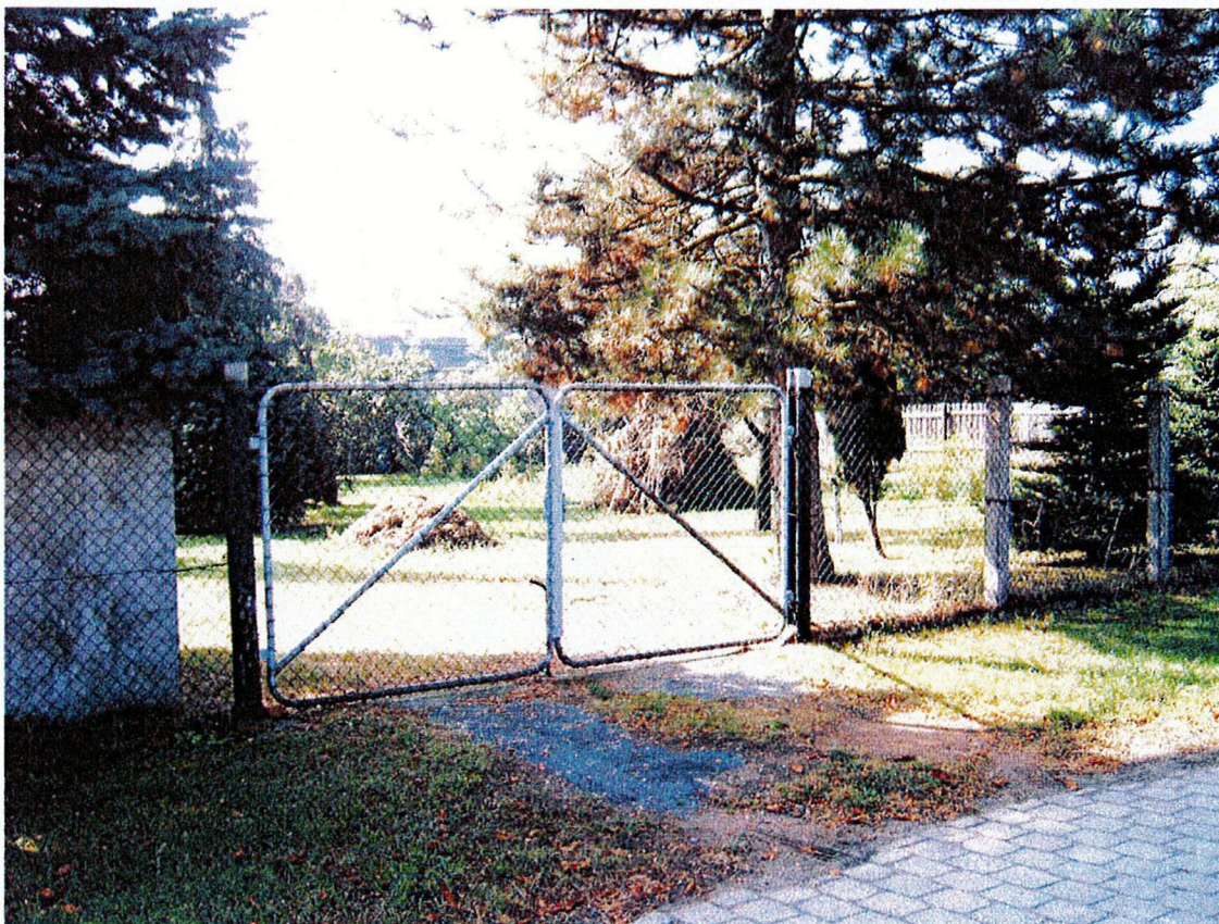
Ergänzungsfläche Nr. 1 südlich der Hauptstraße– östlicher Abschnitt (Nutz- und Ziergärten)