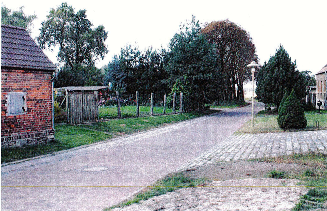
Ergänzungsfläche Nr. 4 am südwestlichen Ortsrand von Buro

Aufgrund ihrer Lage ist die Ergänzungsfläche im Hinblick auf die Erweiterung der Ortslage ähnlich zu bewerten wie die Ergänzungsfläche 3. Sie liegt im Grenzbereich zum Landschaftsschutzgebiet und Biosphärenreservat „Mittelbe“. Die Gemeinde beantragt auch hier die Ausgrenzung bzw. die Erteilung der Ausnahmeregelung für das Nutzungsänderungs- und Bauverbot gemäß den Schutzgebietsverordnungen. Weiteres dazu in den Kapiteln 8 und 9.